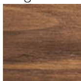
NC noce canaletto